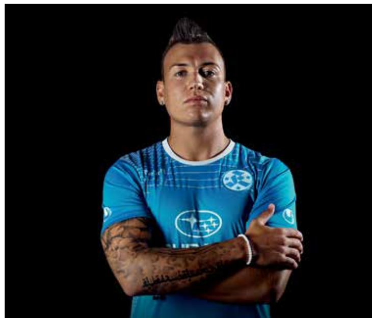
Seine erste Autogrammkarte als Profispieler.