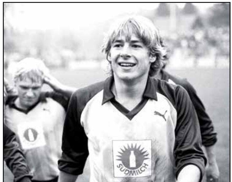
1983: Jürgen Klinsmann im Trikot der Stuttgarter Kickers.