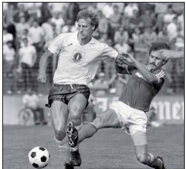
1982: Guido Buchwald im Trikot der Stuttgarter Kickers.